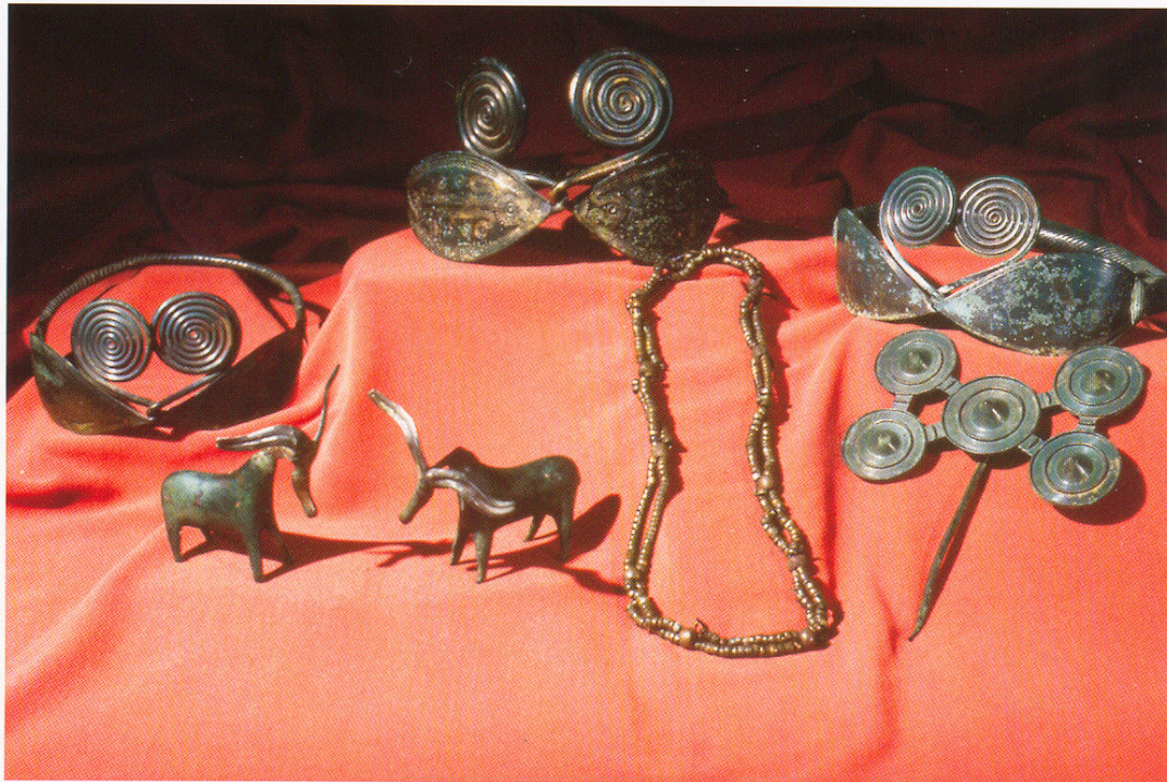
Bronsealderfunnet fra 1925 ved Sverigetjern på gården Vestern på Grindvoll

Kommunestyrets behandling i møtet den 08.09: Side 24 – 26.