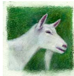
Geitmelksåpe fra Kronebutikken

Brukte varer og antikviteter, skinn-, pels- og lærprodukter, sølv, strikkeprodukter, tova husflidsartikler, garn, glasskunst, kniver, smykker, sukkertøy, urter, sirup, bøker, foto, malerier, såper og mye mer