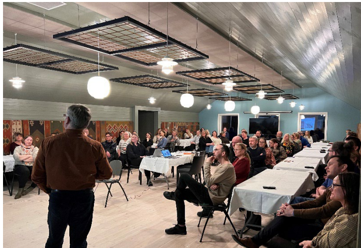
Bilde 7 Lokalmat-møte på Øvre Kjekshus gård mars 2024