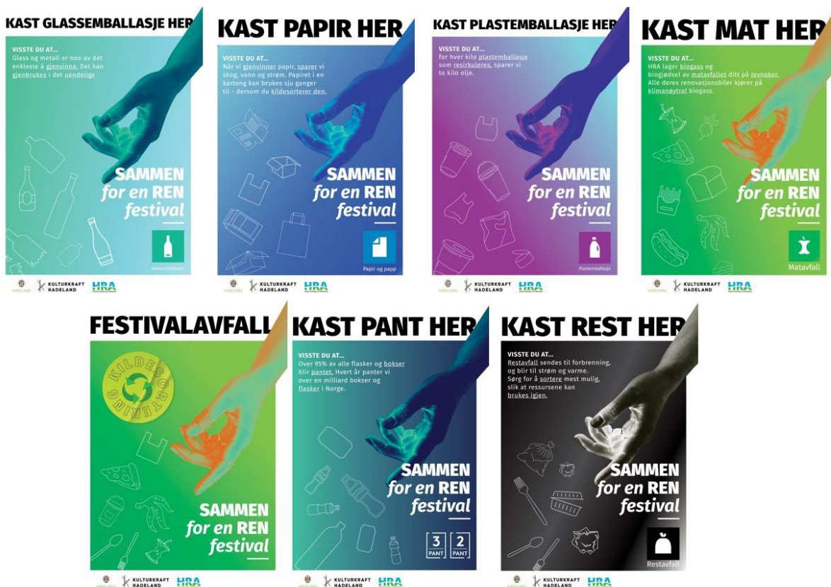
Bilde 6 Plakat og kildesortering i prosjekt kulturnæringsklynge