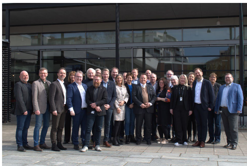
Bilde 3 Samarbeidsmøte mellom GRIP, SNR og Hadeland.