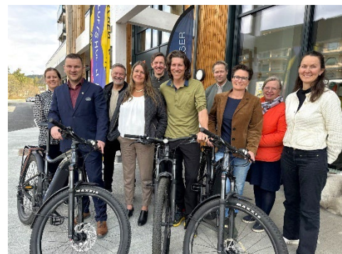
Bilde 4: Interessenter i "Sykling på Hadeland"