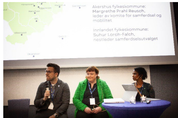
Bilde 2 Representanter fra fylkene på Regional samferdselskonferanse