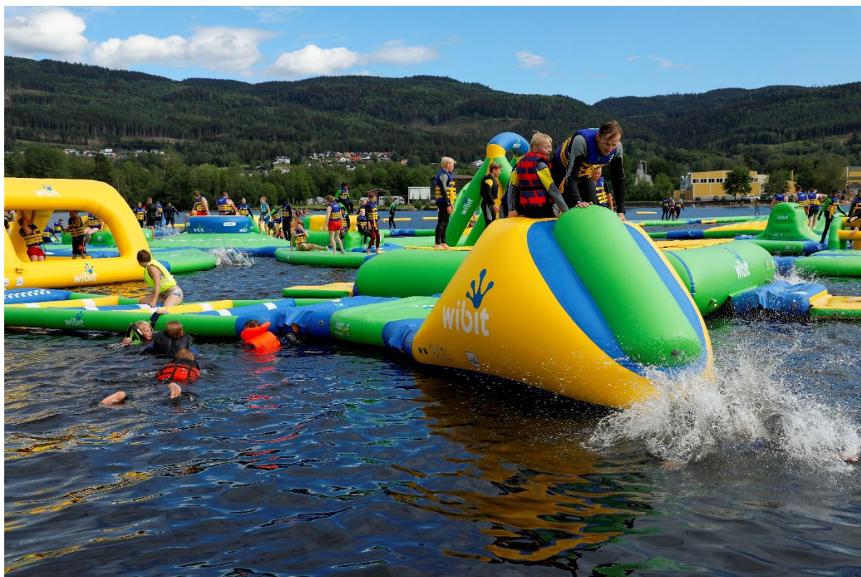
(Bilde fra markedsføringsfilm 2024, «Du kan fortsatt...», Badeparken på Jevnaker)

Det er derfor beskrevet i handlingsprogram for 2025 hvordan man skal samarbeide på tvers av kommunene innen ulike områder. Dette dokumentet er lagt ved sak 28/24.