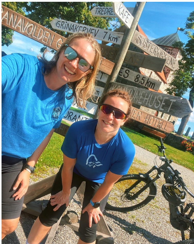
(Vinnere av sykkelkonkurransen 2024, Sykling på Hadeland med to overnattinger)

En kontinuerlig utfordring for IPR er forankring og informasjon om arbeidet som gjøres både til politikken og administrasjonen i kommunene. Det vil i løpet av 2025 utarbeides en kortfattet beskrivelse av arbeidet som gjøres og bakgrunnen for dette slik at deltakerne i representantskapet og andre som er involvert i arbeidet enklere kan forklare hva man bidrar med i et regionalt politisk råd.