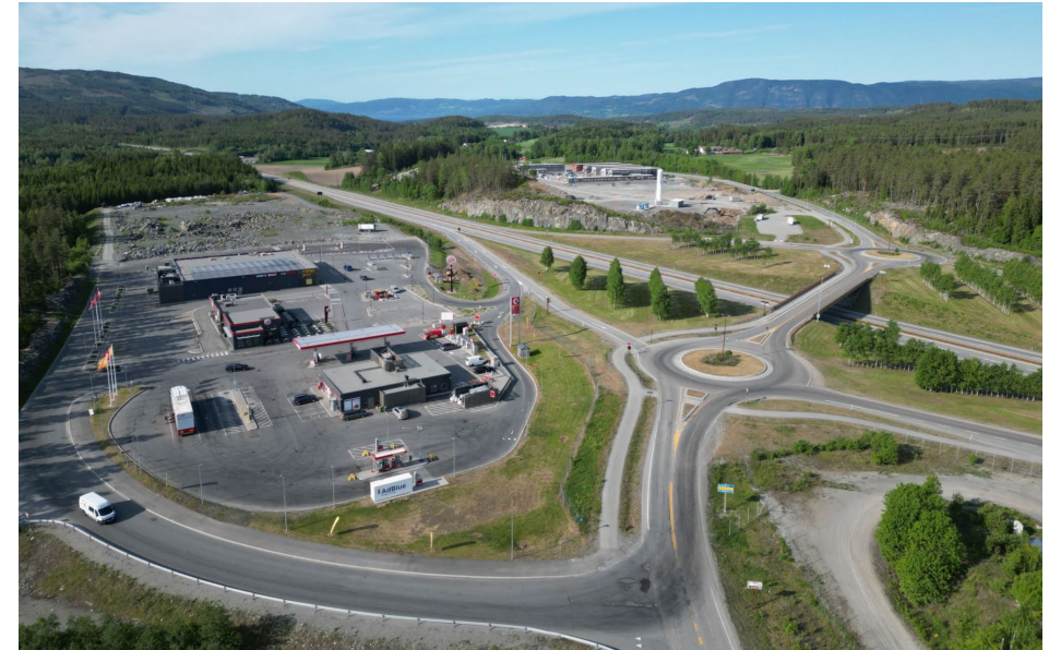
Innlandsporten i Stange – komplett energistasjon.