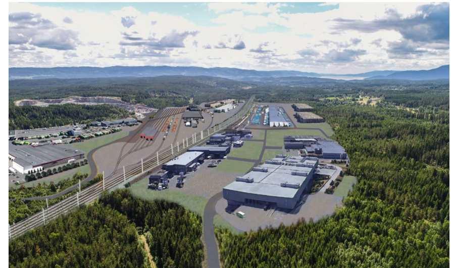
Sørliterminalen i Stange.