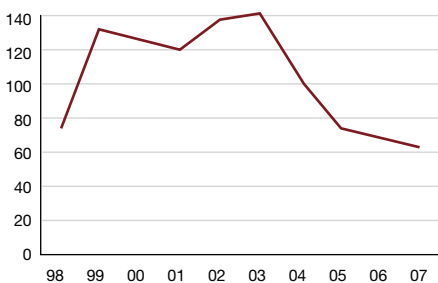
Antall mottak 1998–2007

Det er ikke er god samfunnsøkonomi å betale betydelige summer for mottaksplasser som ikke er i bruk. Derfor har Stortinget bestemt at utnyttelsesgraden skal være minst 80 prosent i transittene og 90 prosent i ordinære mottak. Plassbehovet er vanskelig å beregne, for svingningene i antall nye asylsøkere kan være store. Derfor er en av UDIs største utfordringer å tilpasse kapasitet til behov. Vi må kunne etablere nye mottak svært raskt når ankomstene øker.