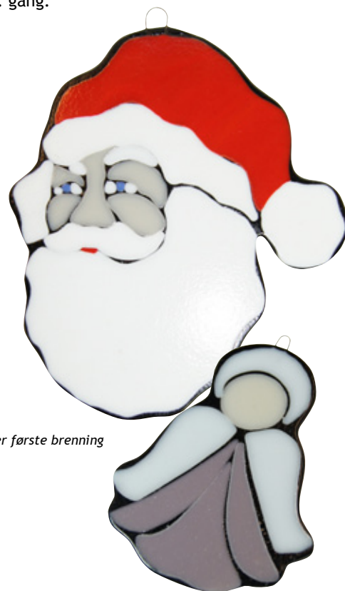
Etter første brenning

8. Etter første brenning tar du gjenstanden ut av ovnen og vasker den. Legg ny brennfolie på plata og legg gjenstanden oppå, denne gangen med det fargede glasset opp. Start ovnen på nytt med samme program. Ønsker du å gjøre engelen litt mer uttrykksfull, kan du dekorere med f. eks. frit, stringer eller GlassLine før du brenner for 2. gang.