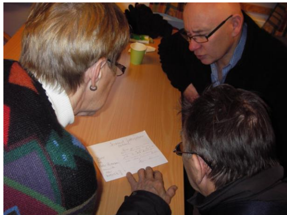
Publikum oversetter brev til fattiggassa fra kvensk til norsk