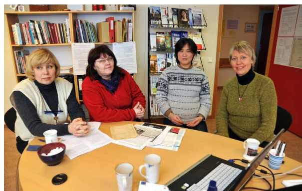
Kom gjerne innom oss for å lete i arkivet. Sagat, 11.12.2008

Fødselspermisjon, en stilling fra april 2009