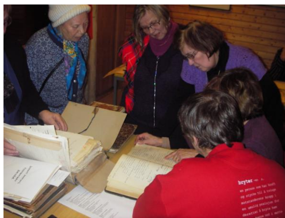
Årbokkomiteen studerer vedtak fra formannskapsmøte

IKAF deltok etter invitasjon fra Karasjok Museums forening på møte i anledning årbok for Karasjok med tema ; ”IKAF som ressurs” . Gjennom intern arbeidstittel: Protokollene ut til Karasjok folket , ble det et muntret møte mellom gamle arkivprotokoller fra før krigen og et lokalt engasjert publikum som fikk lese og supplere med opplysninger og fortellingene og relasjoner til dagens hendelser. Et spennende og interessant møte også for IKAF.