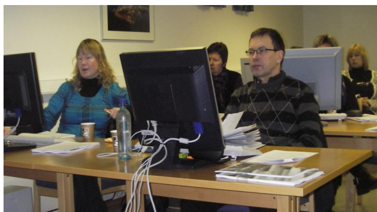
Arkivplankurs 3 dager i Alta med 5 kommuner og 10 deltakere

IKAF har gitt arkivfaglige råd i behandling av moderne arkiv, arkivplan, veiledet og hjulpet kommunene med avlevering av personregister, fagsystemer og elektronisk lagring av arkiv.