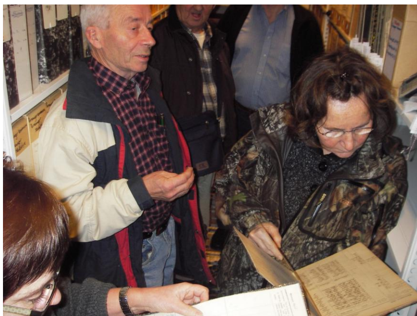
På skattejakt i arkivene: skoleprotokoller fra Kistrand kommune