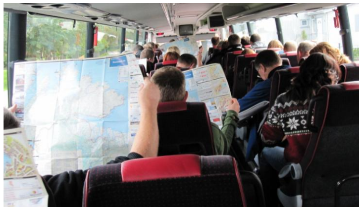
Busstur i Kirkenes