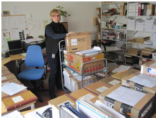
Kontinuerlig avlevering fra kommunene til IKAF

Eldre arkiv, arkiv som er 25 – 30 år og arkiv etter nedlagte organ, skal oppbevares i spesialrom for arkiv, arkivdepot. Det foregår en kontinuerlig avlevering av arkiv fra kommunene til IKAF. Alle saksarkiv og protokoller blir registrert og satt i arkivreolene etter vårt system, noe som er viktig for fremfinning i arkivene, saksbehandling og betjening av innsyn. Samarbeidet med arkivleder/ arkivtjenesten i kommunene er svært viktig i forkant av avleveringene fra kommunene.