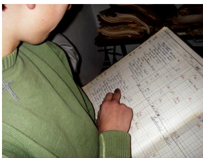
Talviks kommunearchiv og regnskapsprotokoller ble gjenfunnet i 2008