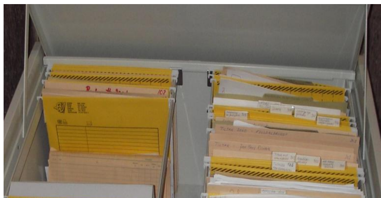
”Avglemt” klientregister funnet i fraflyttet kontorlokale uten tilsyn

IKAF betjente 67 innsyns forespørslers og tilbakelån eller dokumentasjon til kommunene i 2009. IKAF har tatt i mot avleveringer fra 9 kommuner og personregistrene utgjør 370 hyllemeter i depotet.