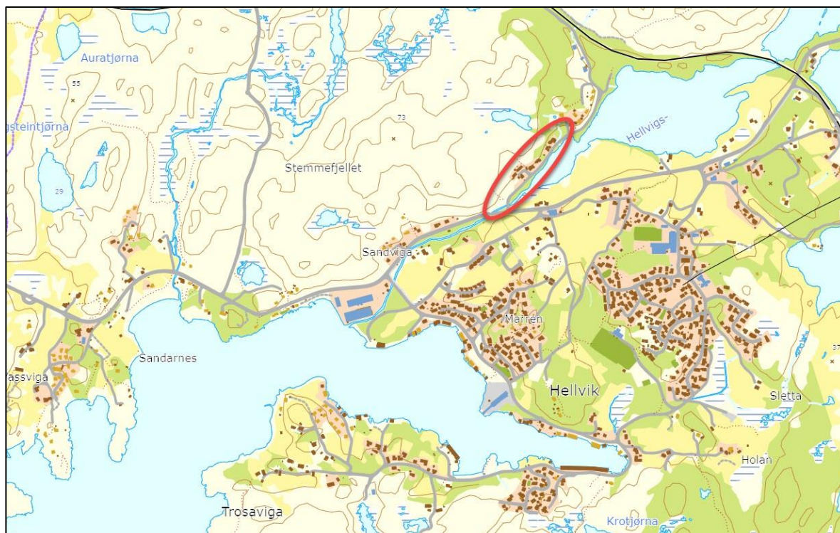
FIGUR 1. OVERSIKTSKART SOM VISER PLANOMRÅDETS Plassering (RØD OVAL).

Norgeshus AS har på vegne av Norgeshus Byggelaget Time AS startet reguleringsplanarbeid for gnr. 60, bnr. 134, 135 m.fl. i Eigersund kommune.