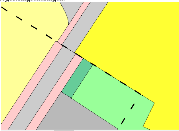
Figur 3 - Overgang ny/gammel regulering

Veg, o_Veg1 og fortau, o_Fortau1 og o_Fortau2 har blitt justert til å følge eksisterende vei fra innmålingsdata. Det er valgt å kun endre formålene frem til overgangen mellom f_U og areal B2 da det ikke er forslagsstillers ansvar å omregulere hele Elganeveien. Det vil være et grensesnitt i reguleringsplanen mellom eksisterende og nytt forslag. Denne overgangen vil bli løst under bygging i samråd med teknisk avdeling. Se eget temakart som viser hvilket område som er blitt berørt av reguleringsendringen.