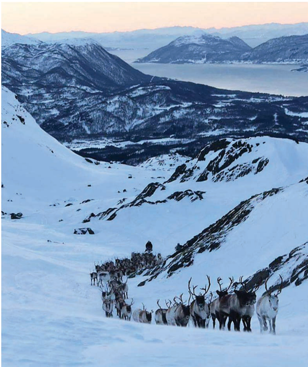
Hjertind reinbeitedistrikt; reintrekk i Børringen