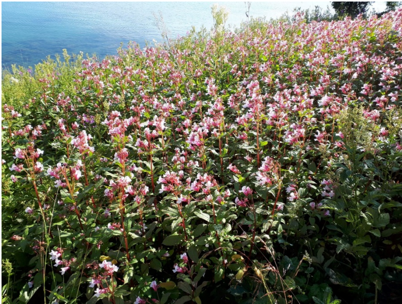
Lokalitet med kjempespringfrø på Furøya.