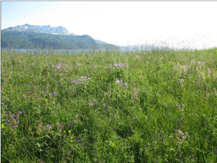
Beitevull i Grunnreis som er lite beitet. Arts sammensetninga er i ferd med endres fra kulturplanter til naturlige arter. Foto Linda Aune-Lundberg. Kilde: Skog og landskap rapport 08/2013. Vegetasjon og beite i beiteområdet til Sørreisa sankelag.

I Sørreisa har vi bare en registrert lokalitet med slåttemark. Dette er en liten lokalitet med C-verdi som ligger i Nordlia. I 2013 ble det utført utført en vegetasjonskartlegging av beiteområdene til Sørreisa sankelag. I forbindelse med denne kartleggingen ble det registrert en del beitevoller, spesielt i områdene Nordlia, Gottesjord, og Grunnreis. Dette kan potensielt være gamle slåttemark som nå benyttes til beiting. Noen av disse arealene kan kanskje restaureres tilbake til slåttemark, men dette avhenger av dagens tilstand. Her trengs det mer kunnskap, og derfor bør det utføres befaringer i samråd med grunneiere og Fylkesmannen for å vurdere arealenes nåværende tilstand og historikk.