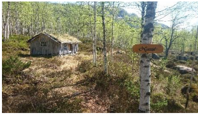
Stølshus, Kvæven bygdetun