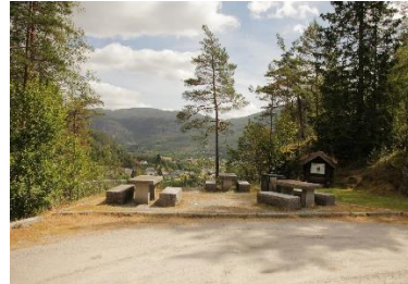
Rasteplass ved Finsådammen