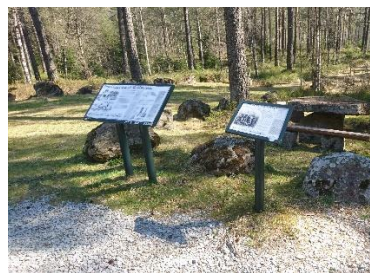
Gravminnefeltet på Skeie

Køyrer du gjennom Hunnedalen til Sirdal, så kjem du til Sinnes. Herfrå kan du køyra nord til Ådneram eller sør mot Tonstad. Sjå beskrivelsar ovanfor.