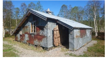
Heiberghytte, Kvæven bygdetun