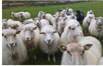
Driftetradisjon i heieområda