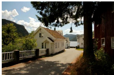
Gamle Tonstad sentrum

Vidare til Tonstad, her kan du få med deg ein del kulturhistorie som er nemnd ovanfor, og du kan leggja turen vidare nordover i kommunen, eller sør mot Evje.