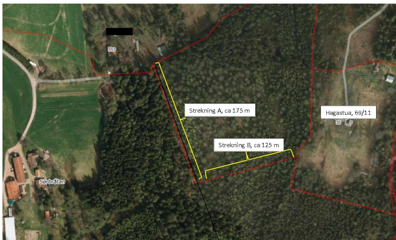
Figur 2 Detaljkart fra søknad