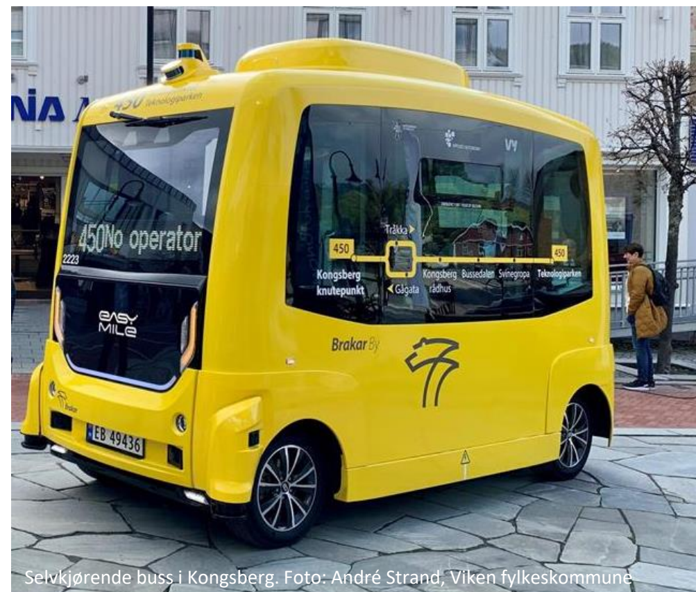
Selvkjørende buss i Kongsberg.

Handlingsprogram for samferdsel omtaler disse utfordringene, men det er behov for egne utredninger for å finne svarene.