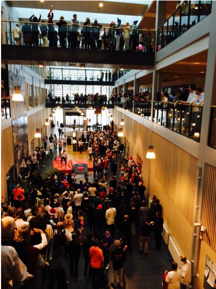
Rom for alle – blick for den enkelte