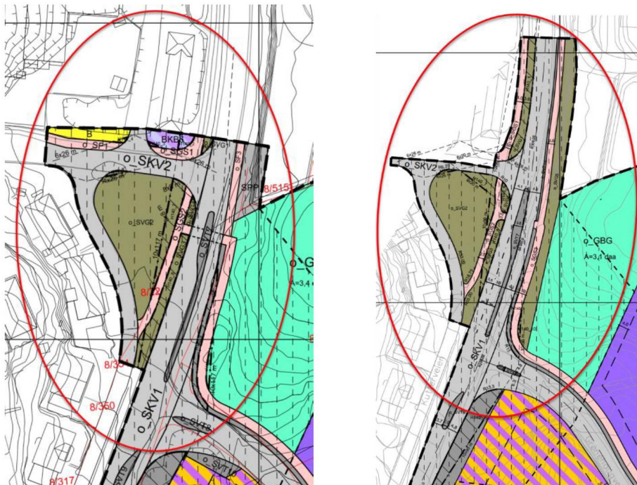
Figur 1 a) Gjeldende plan b) Foreslått planendring. Sirkel viser hvor det foreslås endringer: Samferdselsanlegg foreslås utvidet mot nord og annen veggrunn foreslås regulert mot o_GBG for å sikre nødvendig sidearealer. Fotgjengerkrysning over o_SVT7 foreslås omregulert fra fotgjengerfelt til tilrettelagt krysning.