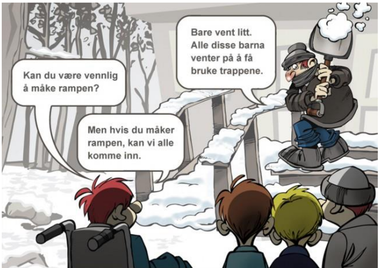
Illustrasjon: Mauricio Pavez / HiB