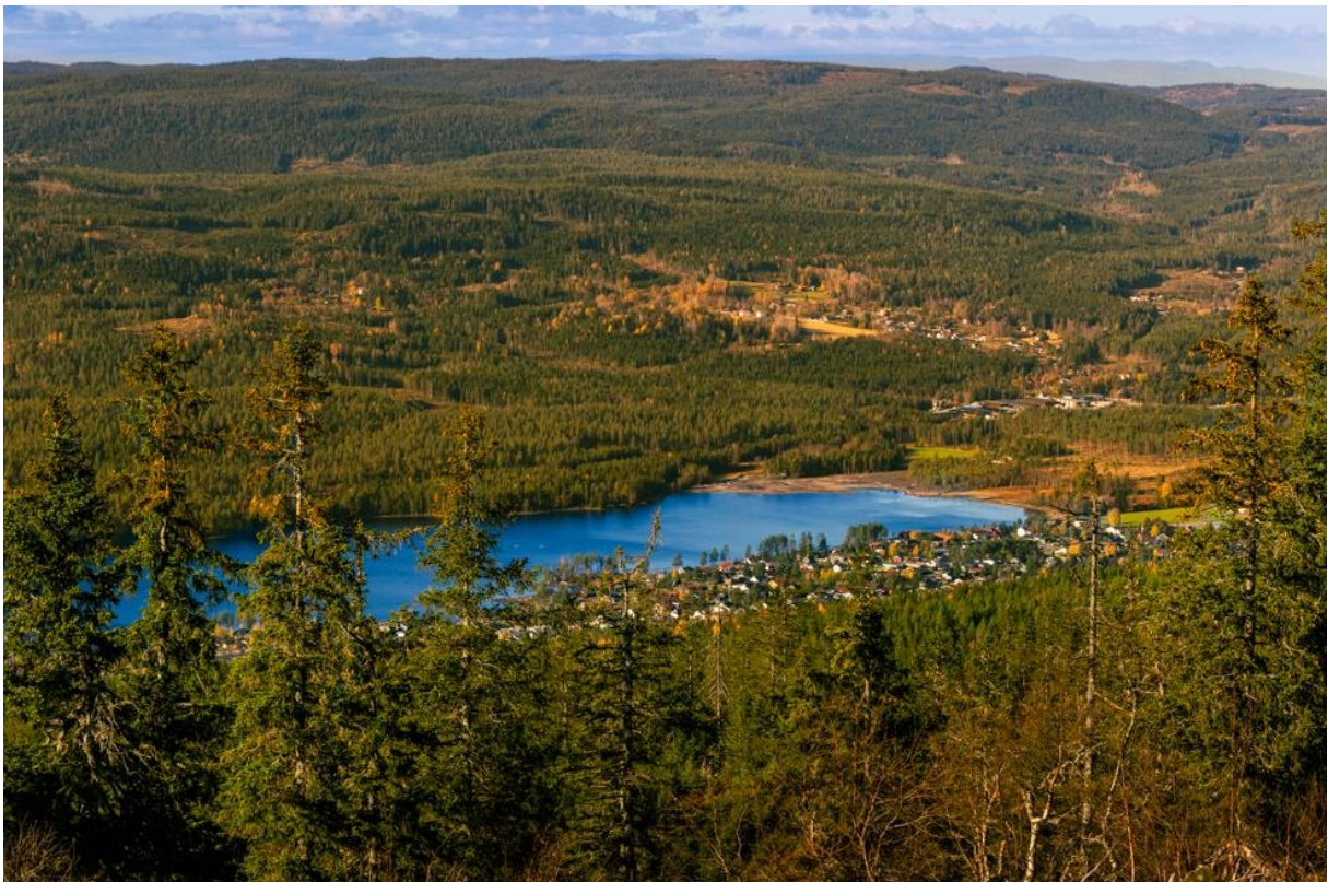
(Paradiskollen, Harestua, 2023. B.T.Stokke)

Navnet på rådet «Hadeland nært og naturlig interkommunalt politisk råd (IPR)» vil i daglig bruk forkortes til «Hadeland IPR».