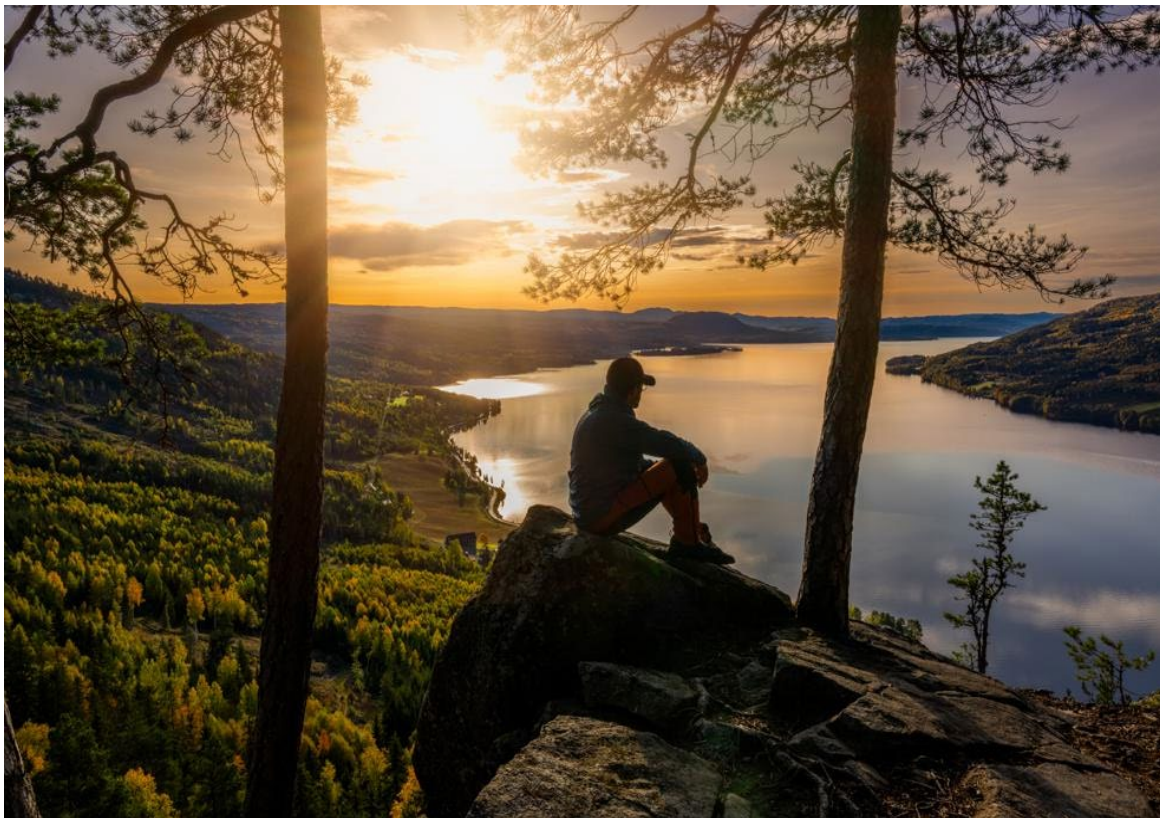
(Hornskleiva, Gran, 2023. B.T Stokke)