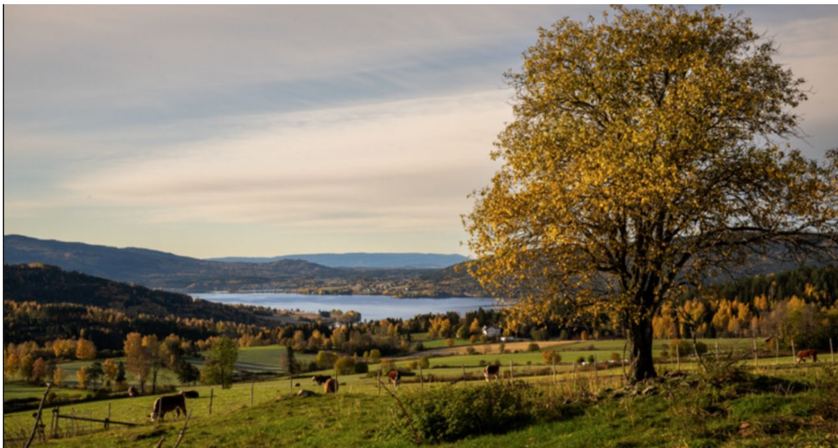
(Sognsbygda, Jevnaker. 2023. B.T. Stokke)

for Hadeland nært og naturlig - Interkommunalt politisk råd