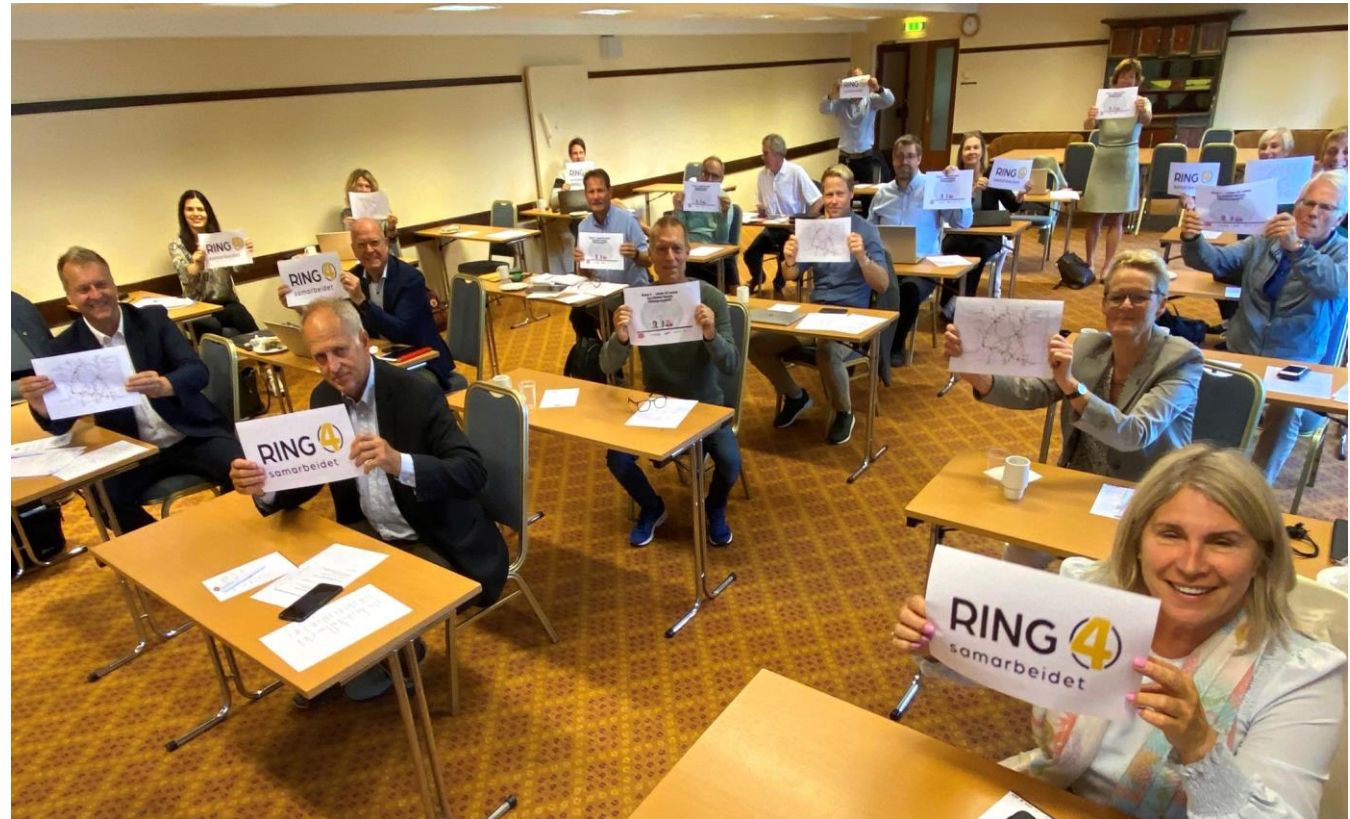
Fra det første årsmøtet på Klækken hotell i 2021