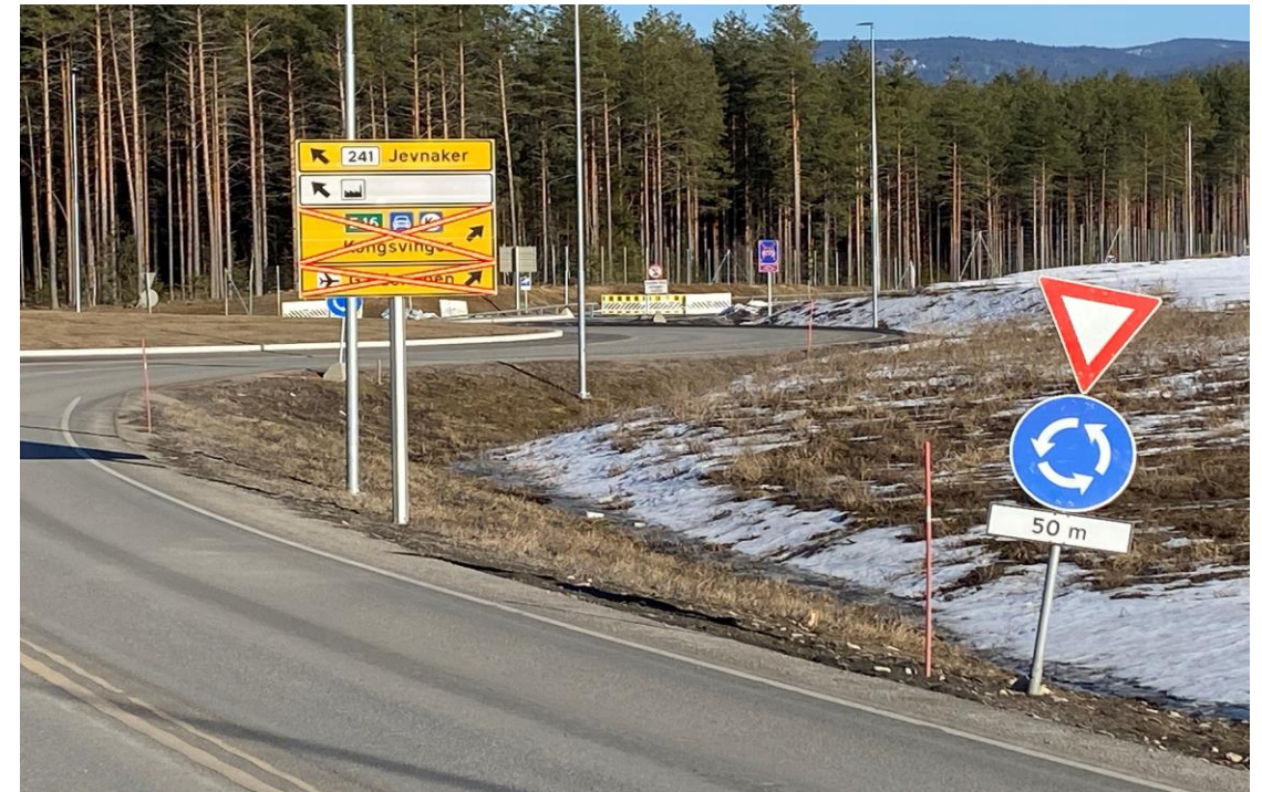
Fra strekningen E16 Eggemoen – Olum, åpnet 7. juli 2022