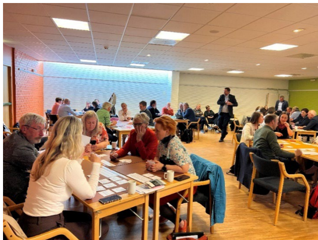
Bilde 1 Hadelandsting 2023