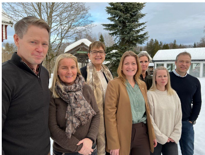
Bilde 4 Nytt IPR. (Morten Hagen og Margaret Frøisli var ikke til stede).

Det er utarbeidet en egen rapport fra dette arbeidsmøtet. 4