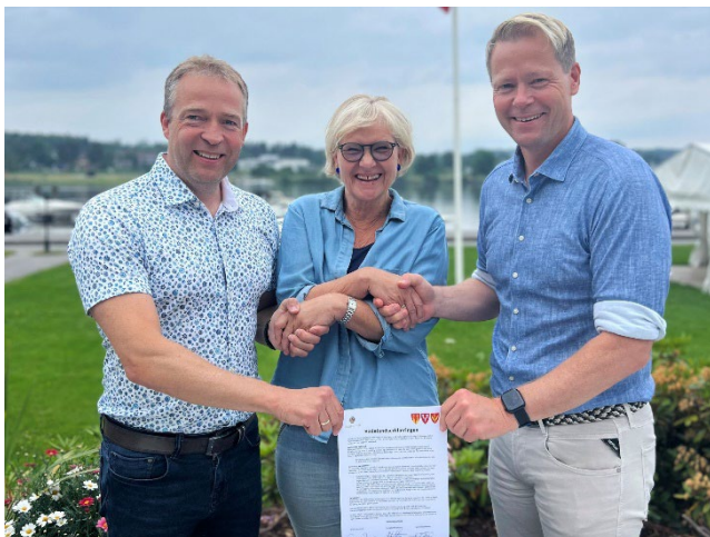
Bilde 3 Signert Hadelandserklæring

Etter forarbeid av ordførerne og innspill fra Hadelandstinget ble Hadelandserklæringen 2 godkjent av alle de tre Hadelands-kommunene i juni 2023.